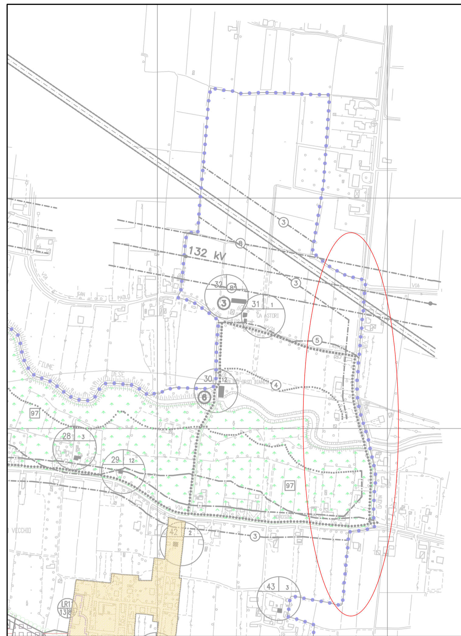
Estratto PRG Martellago tav. 13.1.1 var. 42 - scala 1:5000