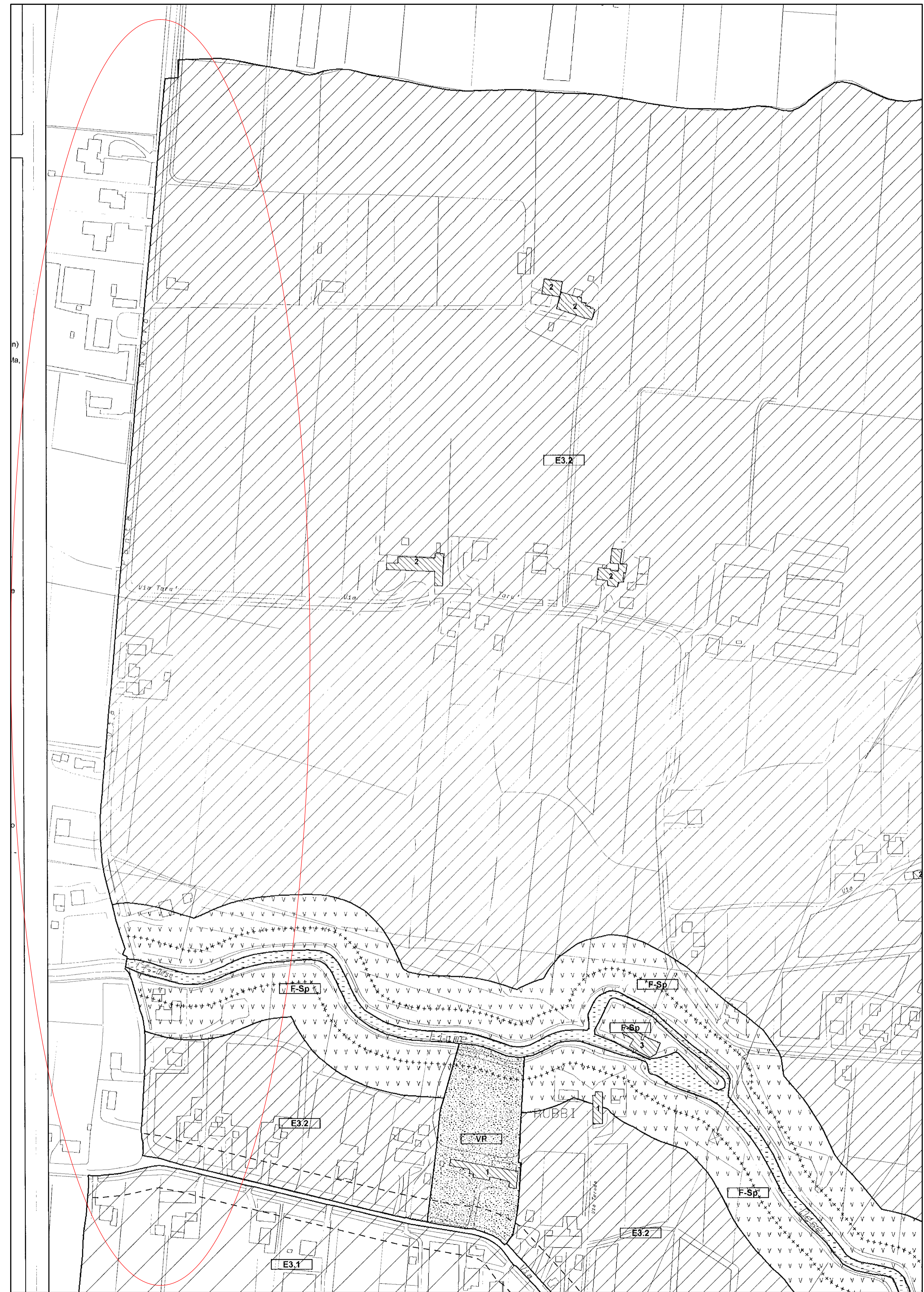
Estratto PRG Venezia - Variante per la Terraferma tav. 13.1.a.1 - scala 1:2000